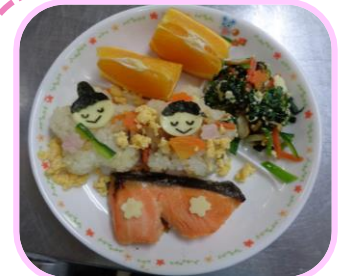
誕生会メニュー&ケーキ